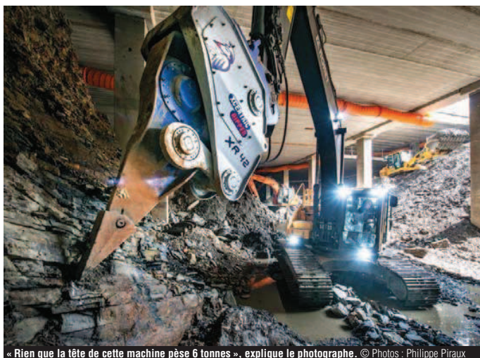
« Rien que la tête de cette machine pèse 6 tonnes », explique le photographe.

Une façon d'opérer qui avait été annoncée avant le début du chantier. Le Grognon se trouvant entre