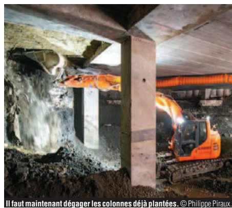
Il faut maintenant dégager les colonnes déjà plantées.