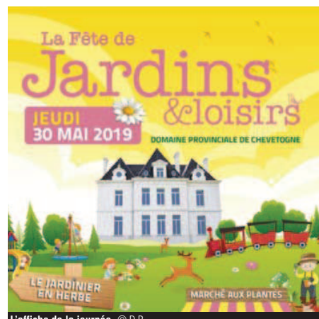
L'affiche de la journée.

à noter L'entrée est à 10 €, et c'est gratuit en dessous de 6 ans. Plus d'informations sur le site de l'événement, lafetedejardinseloisirs.be.