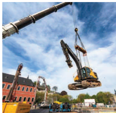
Une énorme grue pour déplacer les véhicules.